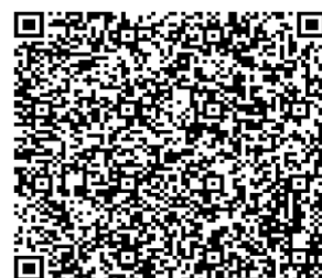
四川网络教研平台 系统使用操作答疑直播